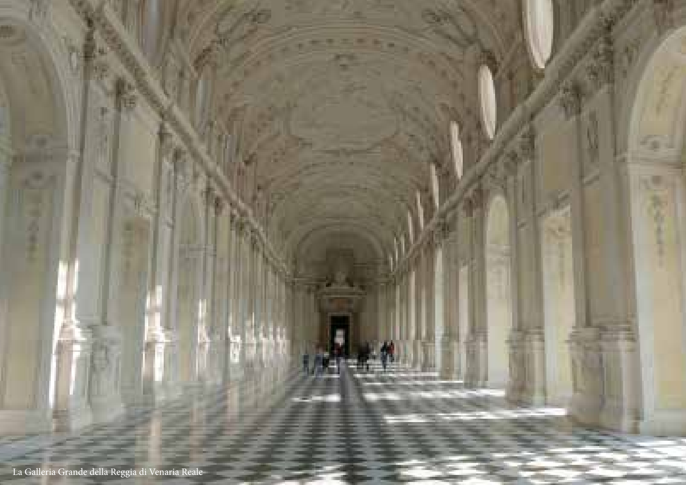
La Galleria Grande della Reggia di Venaria Reale