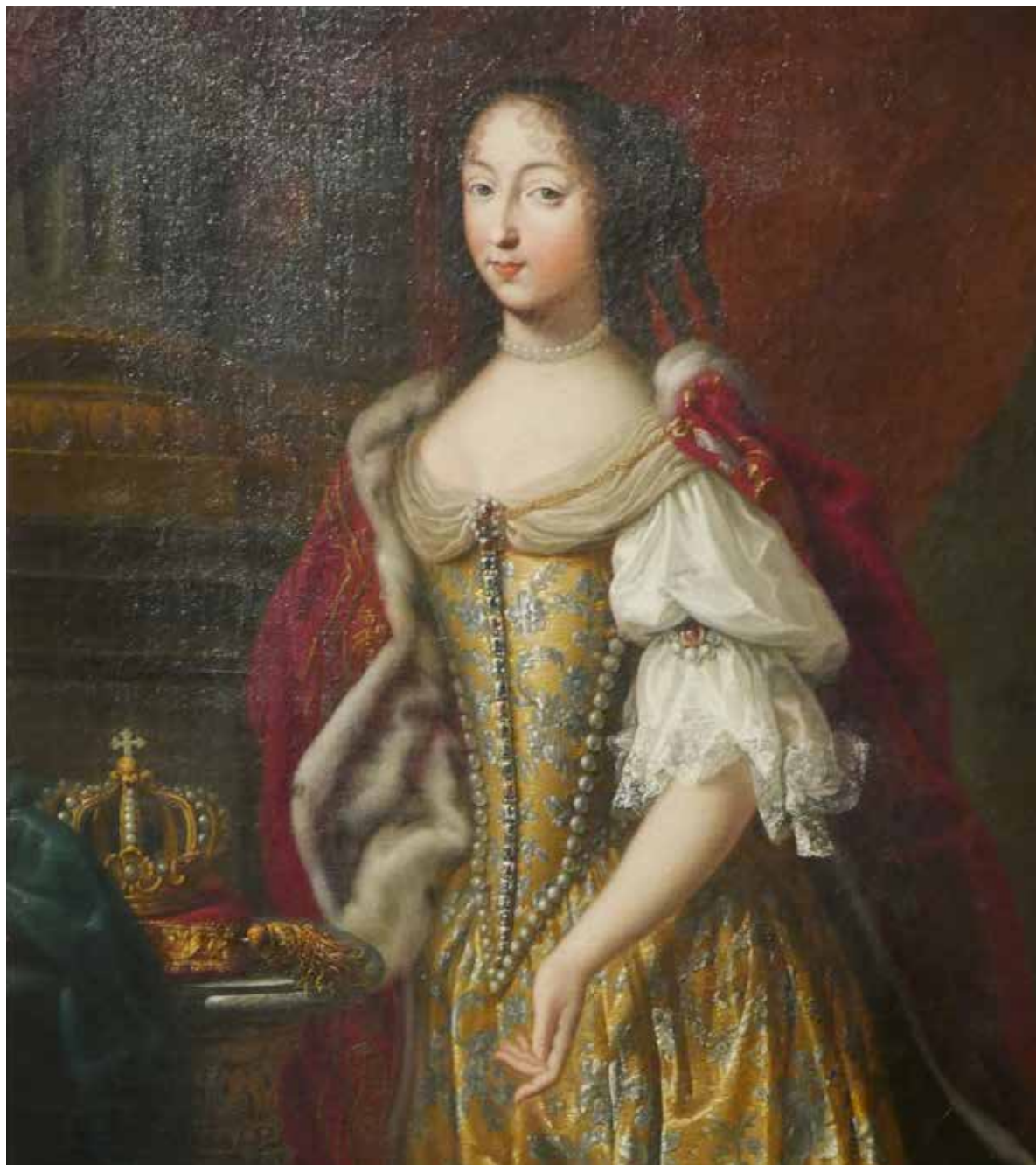
Dipinto di nobildonna. Reggia di Venaria Reale. Torino - 14 ottobre 2018.