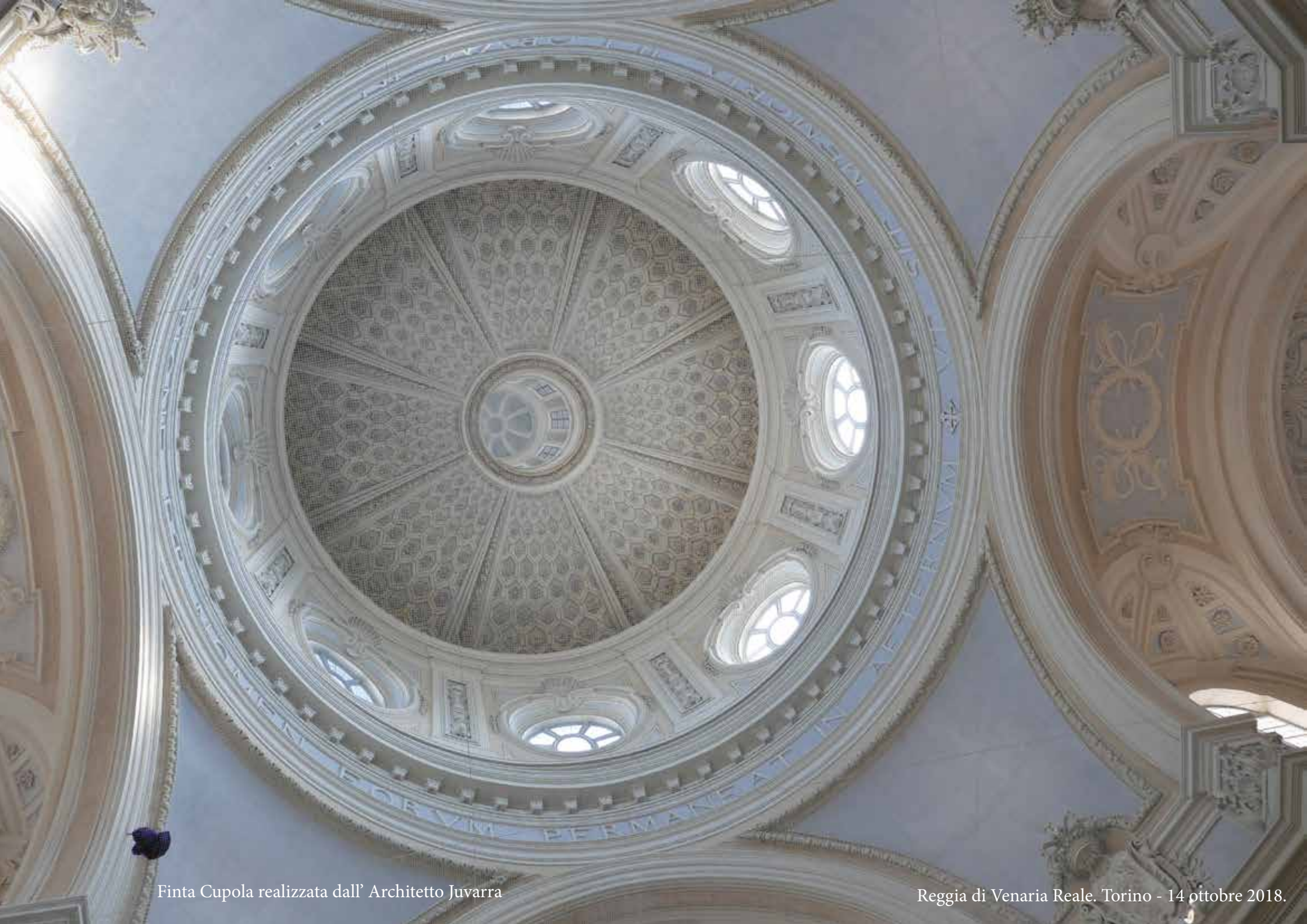
Finta Cupola realizzata dall' Architetto Juvarra