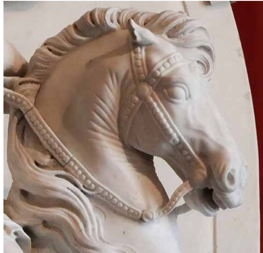
Reggia di Venaria Reale. Torino - 14 ottobre 2018.