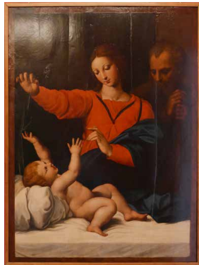
Raffaello Sanzio Copia de La Madonna del Velo Reggia di Venaria Reale. Torino

Reggia di Venaria Reale. Torino - 14 ottobre 2018.